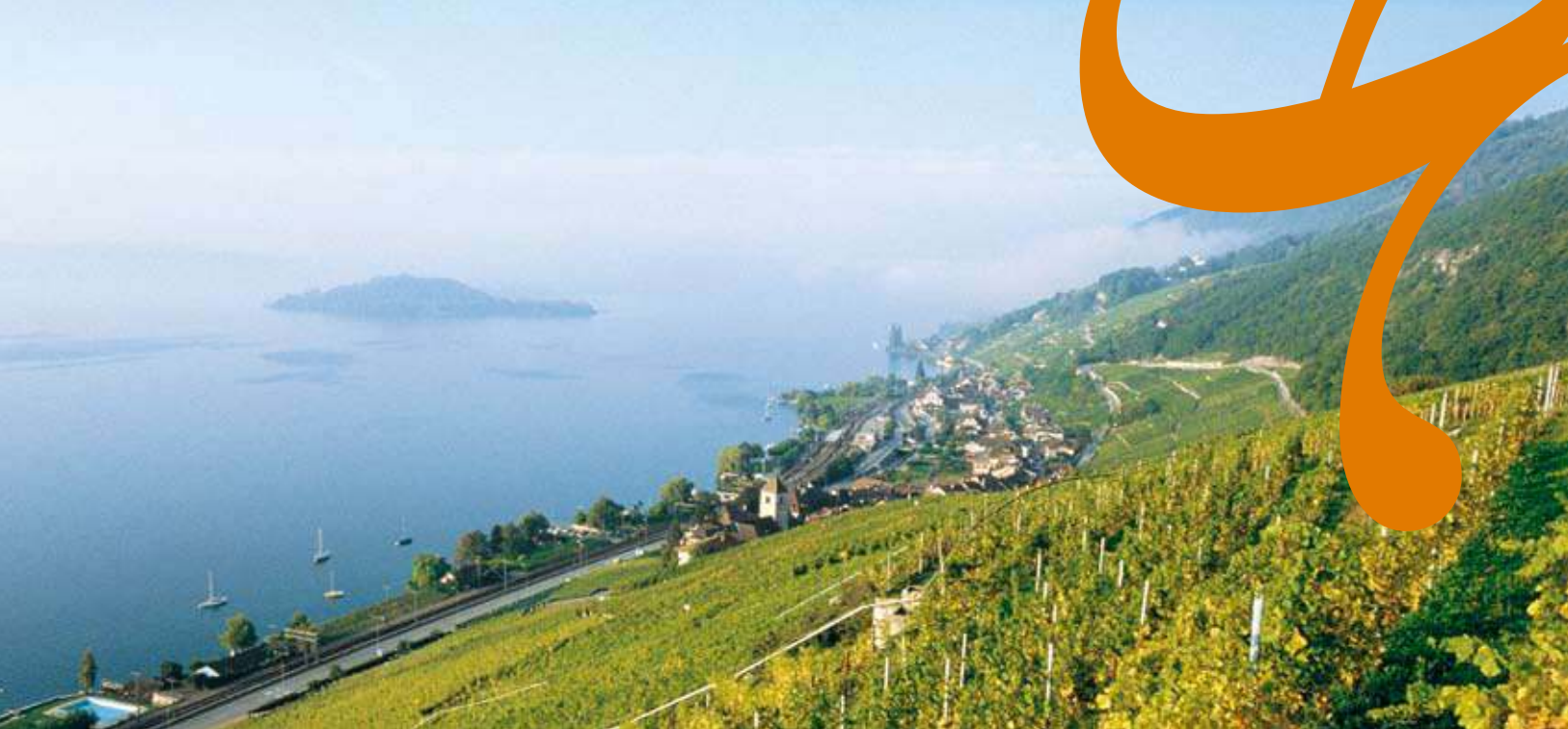
Blick vom Kapf auf Twann