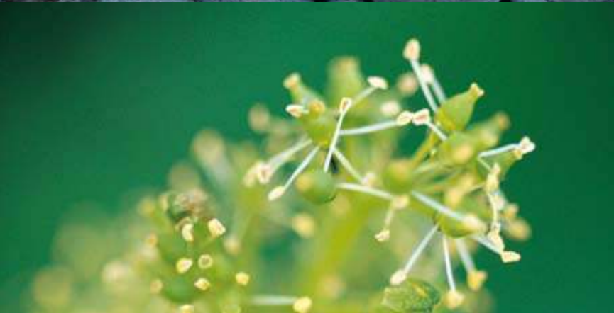
Oben: Pinot Noir Unten: Blühender Sauvignon Blanc