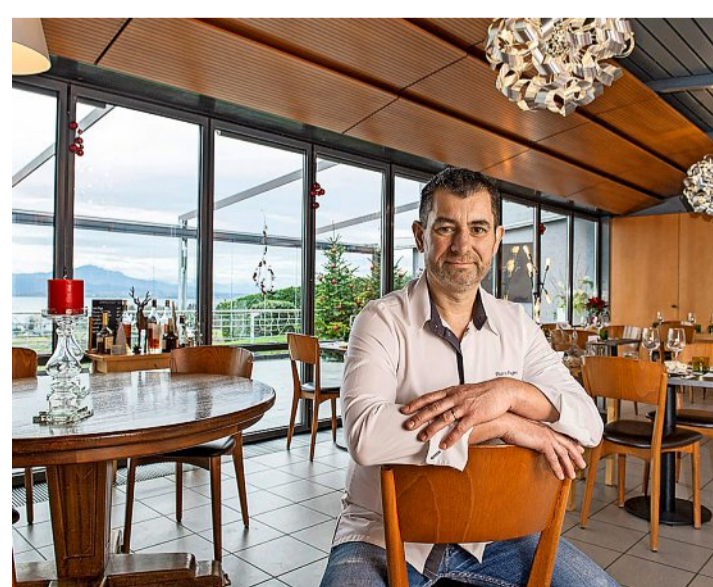
Pierre Puget n'a pas qu'une belle terrasse, il possède aussi un intérieur contemporain et chaleureux. VANESSA CARDOSO

Si la cuisine est française, elle est teintée d'inspirations venues